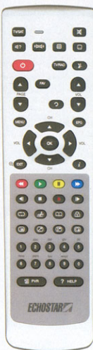
Die übersichtliche Fernbedienung des Festplattenreceivers